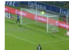
V. Guimarães 1-0 Sp. Braga