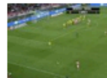
Benfica 1-0 Naval