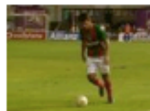
Marítimo 1-0 FC Porto