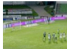
Rio Ave 2-2 Sporting